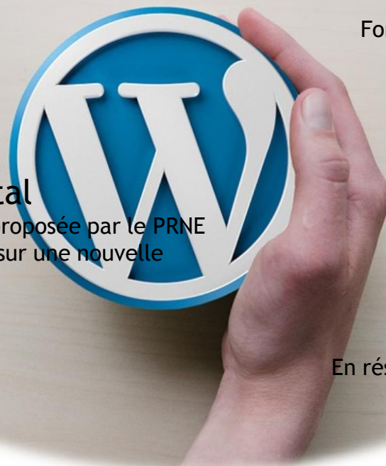
Photo gratuite: Wordpress, Main, Logo - Image gratuite sur Pixabay - 589121