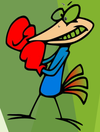
Illustration vectorielle de poussin de boxe publicdomainvectors.org

Les catégories sont des pages virtuelles qui contiennent un listing de tous vos articles associés à ladite catégorie.