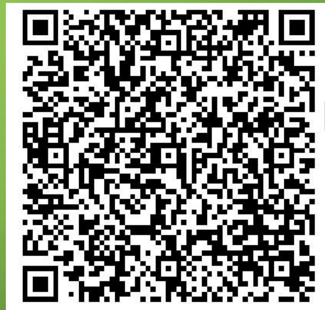
Invitation pièce de théâtre, école de Jepsheim

Pour avoir accès à ce contenu, il faut disposer d'un smartphone ou d'une tablette connectée et d'une application permettant de le lire.